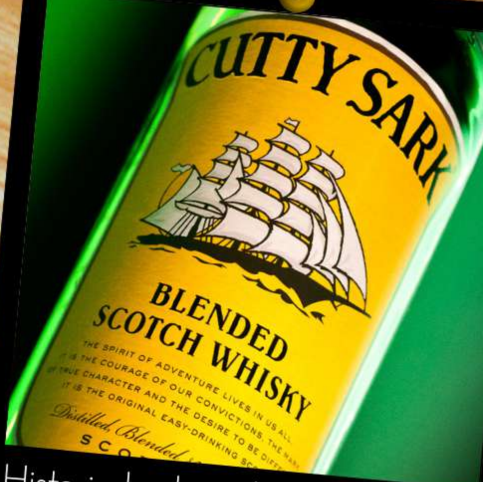
Historia hecha whisky