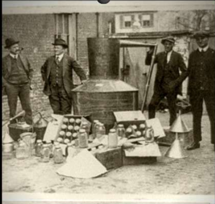
La destilación, arte y técnica