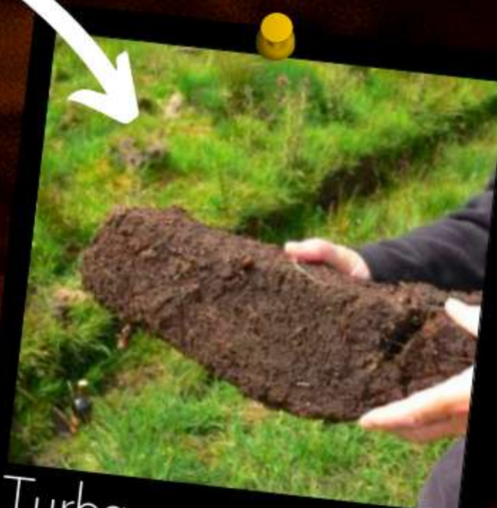
Turba, esencia inconfundible del scotch

Reconocidos por sus notas marinas, de una leve mineralidad a tonos yodados, en esta mezcla aportan una sensación de frescura.