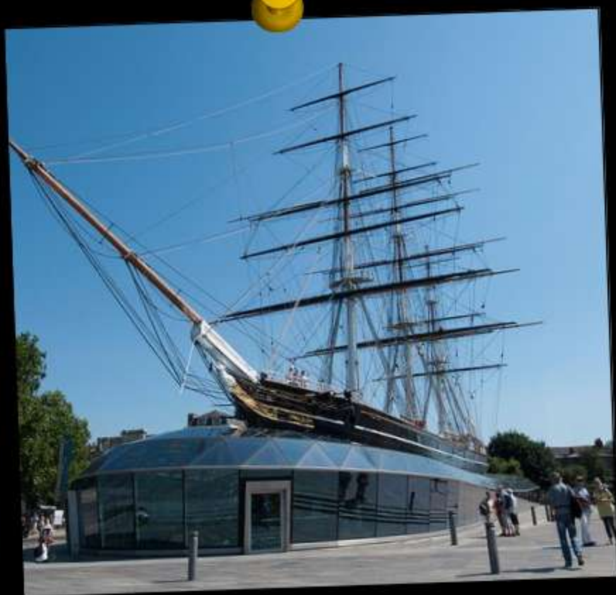
Cutty Sark, Buque museo desde 1954

Al seleccionar el nombre de Cutty Sark, Berry Bros. & Rudd aseguraba dar a su nuevo whisky el brillo de un icono de su tiempo , que la botella ha sabido perpetuar para las nuevas generaciones .