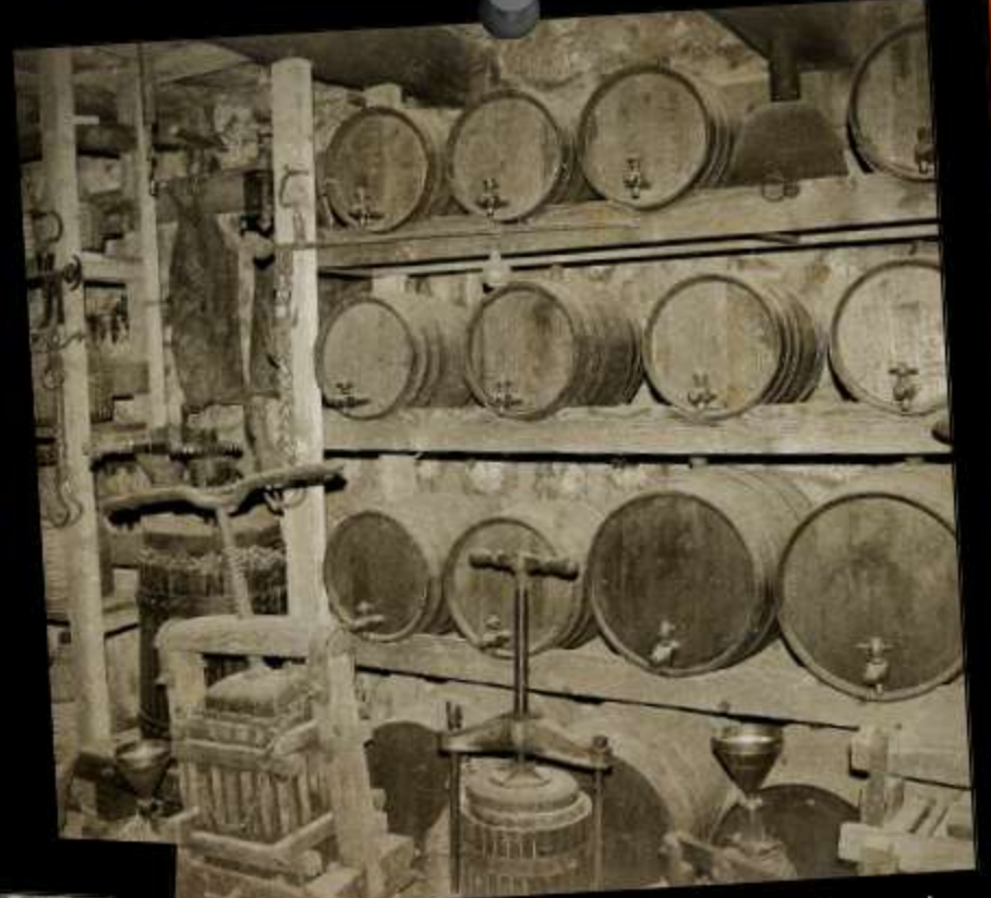
La madera que, junto con el tiempo, transforma al whisky