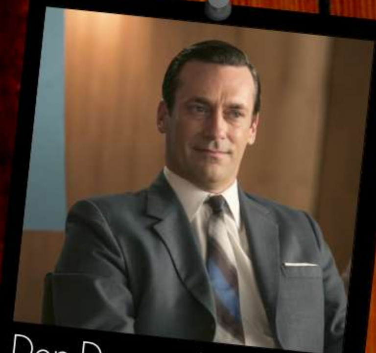
Don Draper. HBO

El director creativo de la firma Sterling Cooper en la serie sobre el mundo de la publicidad Mad men que está ambientada en los años 50, rinde tributo a la popularidad de Cutty Sark entre los 50 y 70 al tenerlo en su bar personal.