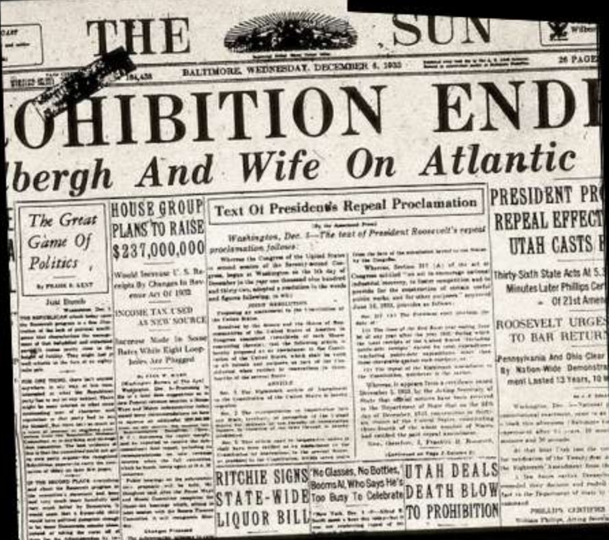
El fin de los duros tiempos de La Prohibición