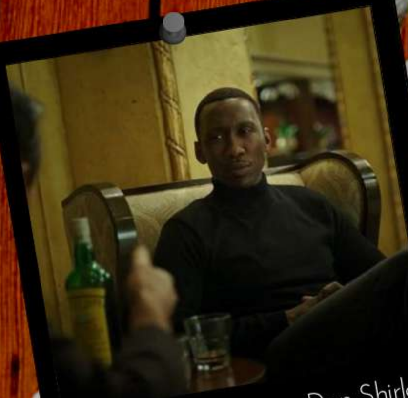
Mahershala Ali como Don Shirley en Green Book.

En la recreación de la vida del pianista de jazz estadounidense, se muestra cómo Mahershala Ali (Oscar de la Academia por esta interpretación), solicita a su conductor tener siempre a disposición una botella de Cutty Sark en su habitación. Esta aparición cinematográfica ha revitalizado la icónica presencia del whisky en la cultura popular.