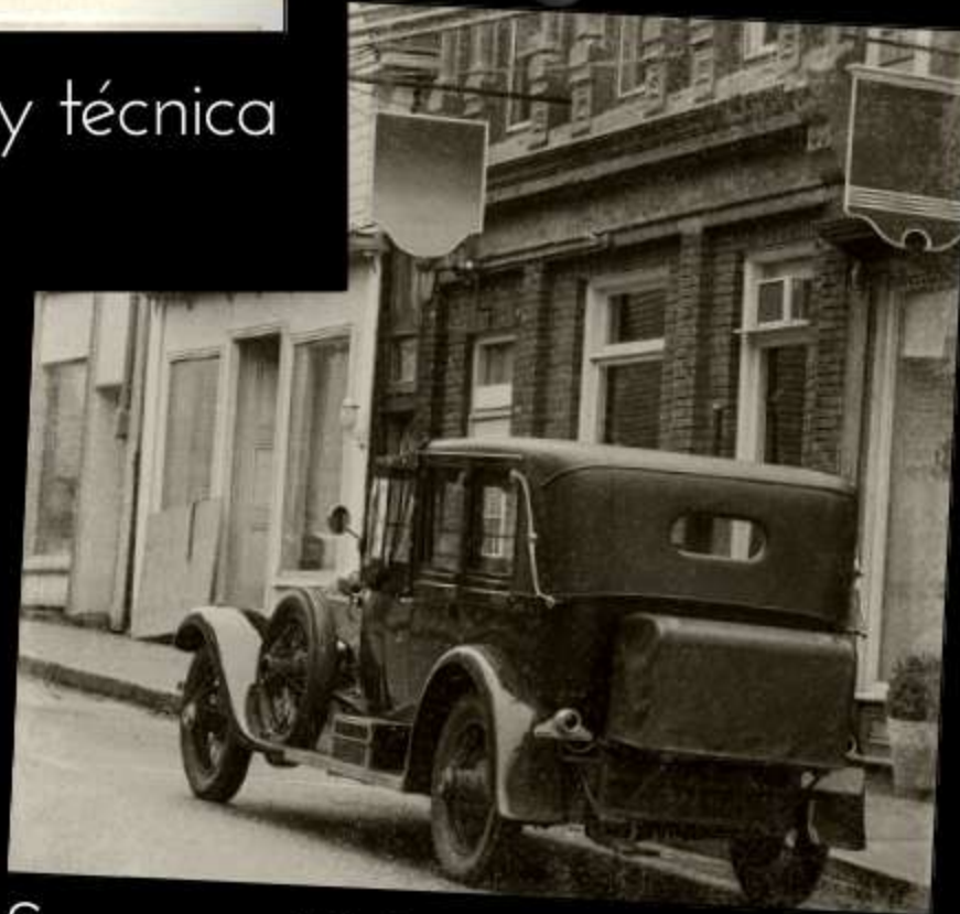
¡Son casi 100 años de historia!