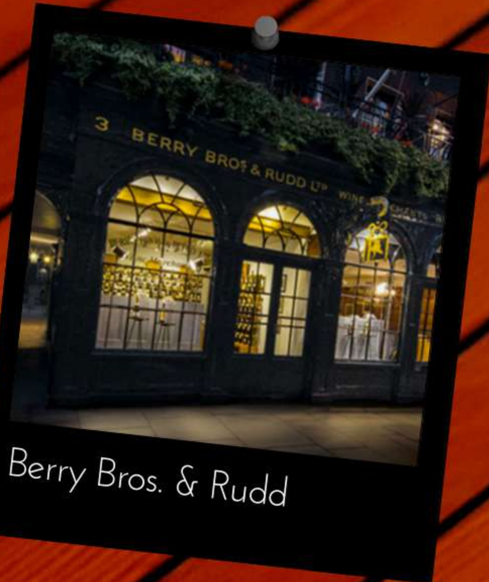
Berry Bros. & Rudd

En su sede del no. 3 de la calle St. James, el 23 de marzo de 1923, nació Cutty Sark.